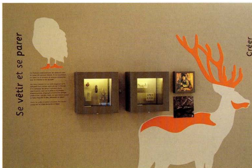
5. Espace « La vie des hommes du Bois-Ragot » : vitrines consacrées au vêtement et à la parure. Lussac-les-Châteaux. Musée de Préhistoire.