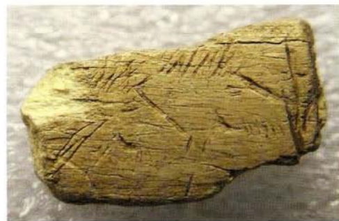
2. Deux têtes de chevaux. Magdalénien. Os gravé. H. 0,01; L. 0,02. P. 0,002. Inv. en cours. Lussac-les-Châteaux. Musée de Préhistoire.

Les œuvres d'art gravées, découvertes notamment dans les contextes magdaléniens (17 000-12 000 ans avant nos jours) de la célèbre grotte de La Marche (commune de Lussac-les-Châteaux) datant d'environ 14 000 ans et de celle des Fadets (commune de Lussac-les-Châteaux) datant d'environ 15 000 ans, ou encore dans les contextes magdaléniens et aziliens de la grotte du Bois-Ragot à Gouex, datant de 13 000 à 10 000 ans avant nos jours, sont les objets phares des collections. De petites, moyennes ou grandes dimensions, elles ont été découvertes par milliers dans la seule grotte de La Marche. Gravées de motifs géométriques, d'animaux (fig. 2), mais aussi et surtout de figurations humaines traitées de façon réaliste, ces pièces sont exceptionnelles. Par leur quantité et leur qualité, ces œuvres d'art gravées sur mobilier caractérisent la spécificité de l'art préhistorique de Lussac-les-Châteaux à la période magdalénienne. Une place et une valorisation particulières leur sont donc accordées dans le nouvel établissement.