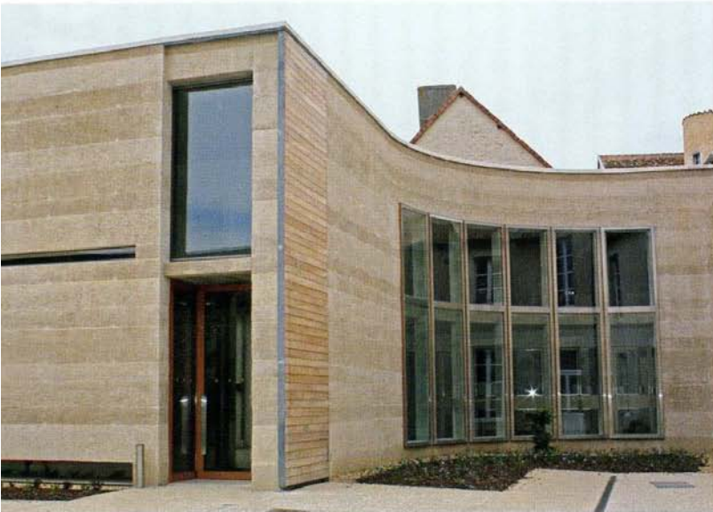
1. Entrée de La Sabline. Lussac-les-Châteaux. Musée de Préhistoire.

Le musée de Préhistoire de Lussac-les-Châteaux a obtenu l'appellation « Musée de France » en janvier 2006. Après plusieurs années de travaux, il est à nouveau accessible au public depuis le 2 juin 2010 au sein de la Sabline (fig. 1), un ensemble culturel comprenant, dans un même bâtiment, le musée, une médiathèque et une Maison des Jeunes et de la Culture. Espace, parcours, muséographie et scénographie ont été entièrement repensés et revisités. Les visiteurs sont invités à découvrir désormais, en plus du nouveau musée, un parcours extérieur, jalonné de totems explicatifs, vers les sites préhistoriques les plus proches.