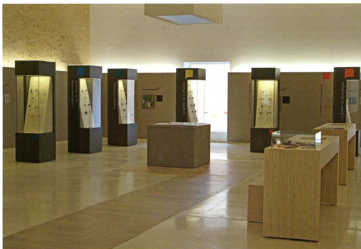
4. Espace consacré aux sites lussacois avec, à gauche et au fond, des vitrines totems. Lussac-les-Châteaux. Musée de Préhistoire.

dans des mobiliers diversifiés, vitrines cloches, vitrines totems, vitrines murales. Le parcours en boucle est ponctué de mobiliers interactifs complétant le discours qui se déroule sur les murs comme une frise chronologique: manipulations d'objets expérimentaux, maquettes, moulages tactiles, loupes intégrées dans les vitrines, audiovisuels, photographies, relevés et dessins illustrés... Pensées et imaginées pour satisfaire le visiteur dans l'approche et l'acquisition des connaissances, les expositions permanentes